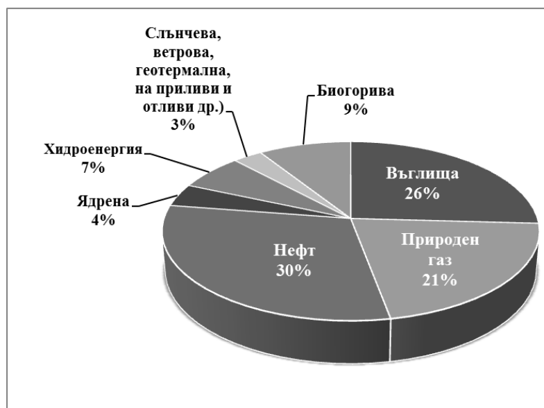
Производство на електроенергия в света от различни източници - 2017 г (в %)