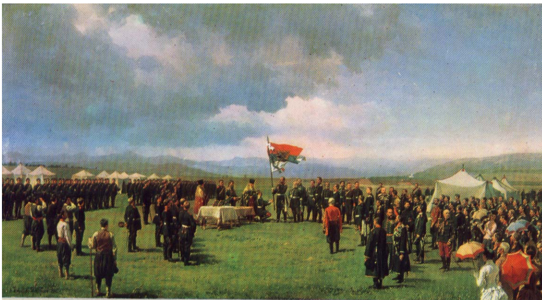
„Връчването на Самарското знаме на българските опълченци”, художник Н. Димитриев-Оренбургски

Б) Кой руски генерал е главнокомандващ на Българското опълчение?